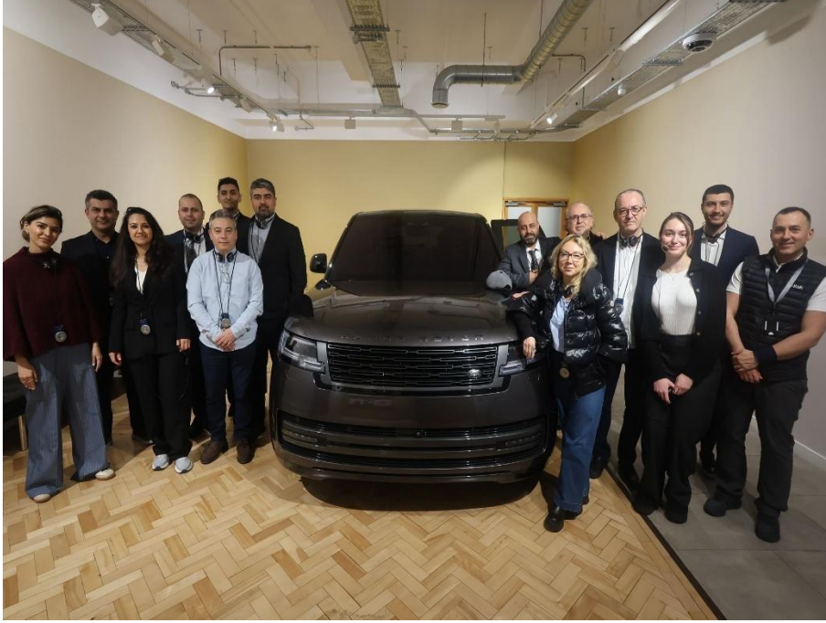
Jaguar-Land Rover Fabrika Ziyareti