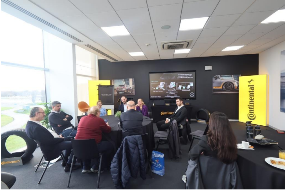
Mercedes-Benz Ziyareti ve Toplantısı