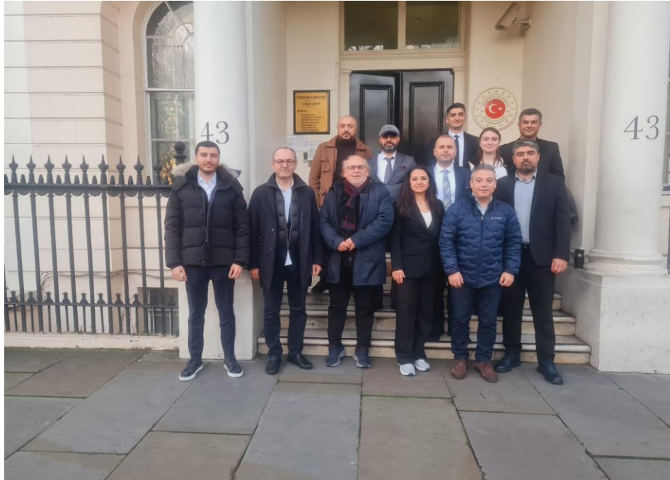
Londra Büyükelçiliği Ziyareti