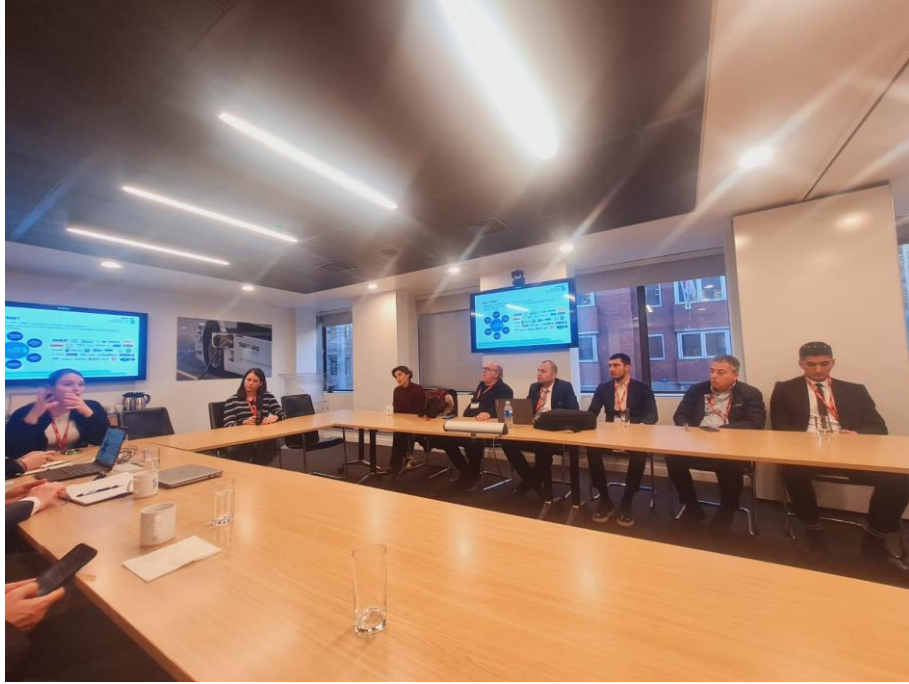
SMMT(The Society of Motor Manufacturers and Traders) Ziyareti